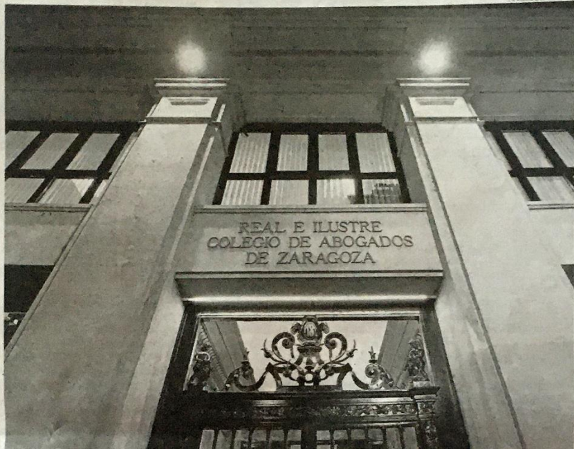
Fachada del Colegio de Abogados de Zaragoza, institución condenada por el Tribunal de la Competencia.

Una legislación incumplida por Reicaz porque elaboró y difundió un listado bajo el nombre Criterios2011 . Destaca este tribunal como ejemplos que el colegio fija en 60 euros el precio a pagar por la consulta de un ciudadano a un abogado con duración inferior a media hora, can-