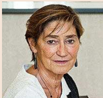
Victoria Ortega Actual presidenta del Consejo General de la Abogacía Española.

Los comicios se celebrarán siguiendo el orden que determina su normativa. Así, según establece el artículo 72.2, en la elección de presidente sólo votarán los decanos, previo llamamiento por orden alfabético. Para ello, los 83 decanos