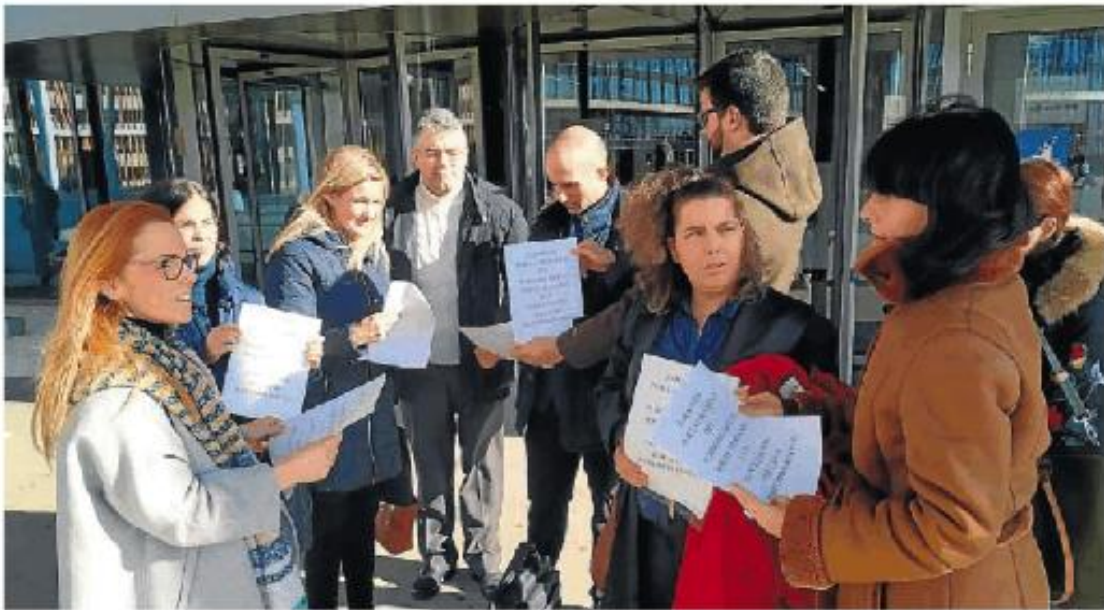
Los letrados se concentraron ayer a las puertas de la Ciudad de la Justicia de Zaragoza. HA