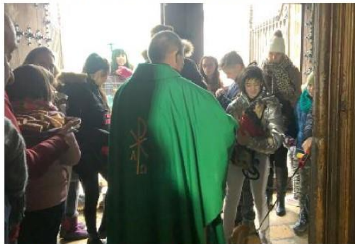
Bendición de las mascotas a las puertas de la iglesia de Calamocha.

trato animal, animó a los vecinos a que denuncien cada caso que conozcan y deseó que los niños, "ciudadanos del futuro, sean mejores que los del presente" en este aspecto. Calahorra, por su parte, recordó la frase de un colega que dice que "el Derecho de los Animales es la única rama del Derecho en la que sabes que tus clientes son inocentes" y pidió que se continúe con la labor que se atribuye a San Antonio Abad.