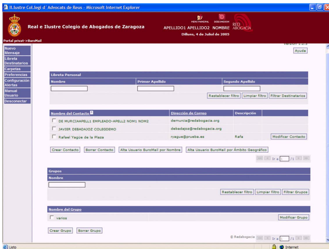
Ilustración 3: Gestión de contactos en Libreta Personal

Con la opción de “Crear Contacto”, añadimos nuevos destinatarios que no pertenecen a la categoría de usuarios del BuroMail. Puede ser cualquier correo electrónico válido. Esta característica es para poder remitir copia del envío de BuroMail a destinatarios que no dispongan de certificado ACA.