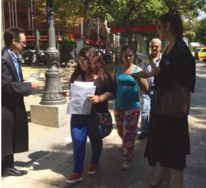
Miembros de la Junta Directiva de la AAJZ participando en Madrid en la concentración celebrada el 24 de julio de 2.014 en contra del Proyecto de Ley de Asistencia Jurídica Gratuita.

En el año 2014 se concedieron más de 40 subvenciones para asistir a actividades formativas, por un importe total de 1.392,50 euros; partida que este año 2.015 ha quedado definitivamente presupuestada en la cantidad de 1.700,00 euros, por lo que la AAJZ aprovecha estas líneas para invitar a todos los Agrupados a solicitar subvenciones de conformidad con los criterios aprobados y publicados en el espacio web de la AAJZ.