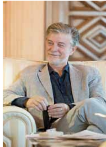
Pedro Santistevé Roche

La redacción de esta revista colegial, no podía dejar pasar la ocasión de entrevistar a nuestro querido y comprometido compañero, Pedro Santistevé, quien como es habitual en él, nos concedió un espacio dentro de su apretada agenda como Alcalde. Comprobamos que el Pedro Santistevé persona pública, sigue manteniendo su entrega personal por la que siempre se ha distinguido en su ejercicio como abogado. Y si se nos permite la apropiación, es el Alcalde de los ciudadanos de Zaragoza, pero si cabe un poquito más de nosotros los abogados de este Colegio.