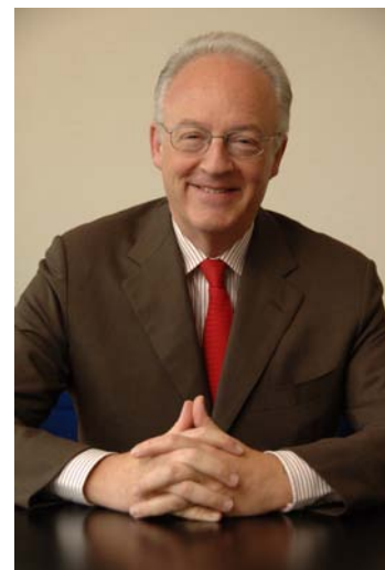
Georges-Albert DAL Presidente de CCBE 2011

Además, las provisiones de la propuesta de Directiva sobre derechos de los consumidores, que permitiría retirar contratos desde la distancia y fuera del lugar de referencia, preocupan a CCBE en tanto en cuanto no excluya los servicios prestados ya por abogados. Estamos haciendo notar a eurodiputados que los abogados se encuentran sujetos a reglas profesionales estrictas que les obligan a informar a sus clientes de sus derechos y obligaciones, sobre todo el derecho del cliente a terminar su relación contractual en cualquier momento. Es más, estamos subrayando el hecho de que las nuevas normas, de aplicarse a los abogados, les disuadirían de dar asesoramiento legal antes de que finalice el plazo marcado, en detrimento del cliente, el “consumidor” que esta Directiva pretende proteger.