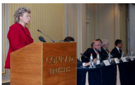
Viviane Reding, Comisaria responsable de la cartera de Justicia, Derechos fundamentales y Ciudadanía

El evento de clausura del 50 aniversario de CCBE fue una conferencia organizada conjuntamente con ERA, la Academia de Derecho Europeo, y tuvo lugar en Bruselas el pasado 26 de noviembre, bajo Presidencia belga, sobre el tema de “Asistencia Jurídica gratuita para los Ciudadanos – Acceso efectivo a la Justicia en la UE”, inaugurada por la Vice-presidenta de la Comisión Europea, Viviane Reding, responsable de la cartera de Justicia, Derechos fundamentales y Ciudadanía.