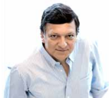
José Manuel Barroso Presidente de la Comisión Europea

El Presidente de la Comisión Europea, José Manuel Barroso, anunció el pasado 15 de septiembre de 2009, al buscar el apoyo del Parlamento Europeo para su reelección, que dividiría la cartera del Comisario Barrot en dos, separando los ámbitos de Justicia y Asuntos de Interior. Todo ello fue confirmado el 27 de noviembre de 2009 con el nombramiento de Viviane Reding como Comisaria para Justicia, Derechos Fundamentales y Ciudadanía, y de Cecilia Walström como Comisaria de Asuntos de Interior. Ya desde 2003, CCBE ha venido pidiendo el establecimiento de una Dirección General de Justicia separada en el seno de la Comisión. La división de carteras es un paso adelante en la correcta dirección para Europa ya que, con ello, se ayudaría a atraer la atención hacia numerosos asuntos importantes en materia de Justicia en Europa y se evitaría que otros temas jurídicos destacados se dispersaran hacia otras Direcciones Generales, tal como sucedió en el caso anterior. No obstante, CCBE cree que la reorganización no debería detenerse aquí, puesto que duplicar los cargos de Comisarios situados en lo más alto de una plantilla administrativa proveniente de una única Dirección General (de Justicia, Libertad y Seguridad) no soluciona completamente el riesgo continuo de tensiones entre las cuestiones de seguridad por un lado y las cuestiones relativas a Justicia y derechos fundamentales por otro, en detrimento de éste último.