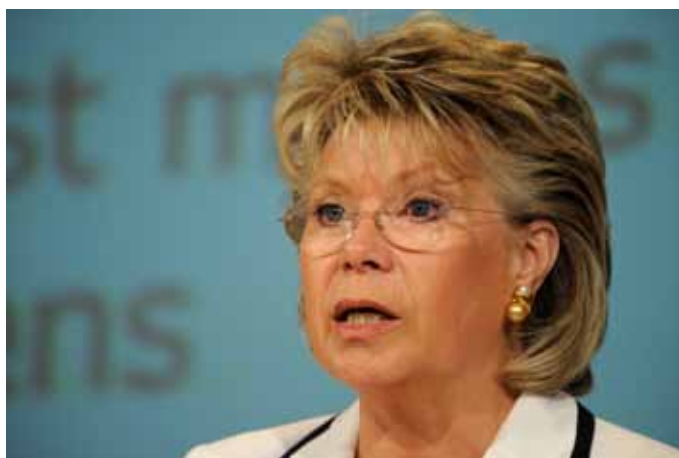
Viviane Reding Comisaria para Justicia, Derechos Fundamentales y Ciudadanía

Además, CCBE también ha tomado en consideración la posición de la Comisaria para Justicia, Derechos Fundamentales y Ciudadanía, Viviane Reding, en su presentación de la perspectiva política de la Comisión sobre el MCR como posible instrumento para el Derecho contractual europeo. La Comisaria tiene intención de completar – con la ayuda de expertos académicos de toda Europa- el trabajo sobre el Marco Común de Referencia durante el año 2010, e incluirlo, además, en un instrumento legal bien publicitado. Además, ha