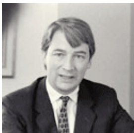
James Flynn QC

Tal y como se informaba en el CCBE Info n° 19, el Tribunal de Primera Instancia de la UE publicó el pasado 17 de septiembre de 2007 su sentencia sobre los asuntos acumulados Azko Nobel Chemicals Ltd. c. Comisión Europea, casos T-25/03 y T-253/03. Puede encontrarlas pinchando en el siguiente enlace: http://curia.europa.eu/jurisp/cgi-bin/form.pl?lang=ES&Submit=rechercher&numaff=T-125/03 . La cuestión principal de ambos casos era la definición del secreto profesional de los abogados de empresa, en relación con el Derecho comunitario de Competencia.