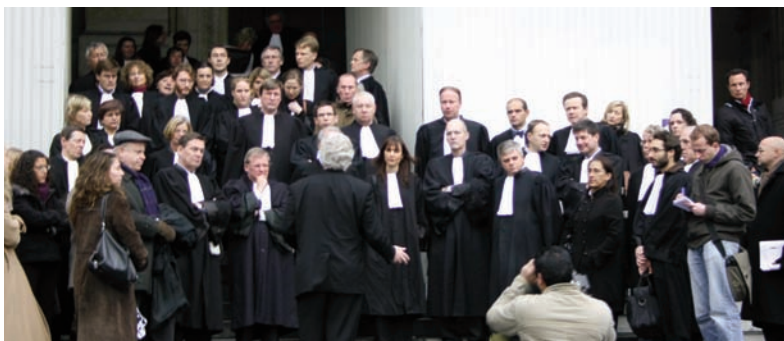
Manifestación de solidaridad con la Abogacía Pakistán en el Palacio de Justicia de Bruselas

El pasado 10 de diciembre, con ocasión del Día Internacional de los Derechos Humanos, CCBE organizó una manifestación de solidaridad con la Abogacía Pakistán en el Palacio de Justicia de Bruselas. Tras la manifestación, el Presidente de CCBE se reunió con el Embajador de Pakistan y le hizo entrega de una carta con las preocupaciones de la Abogacía Europea junto con una resolución aprobada en París por las Abogacías