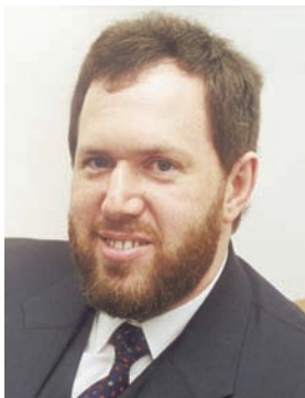
Péter Köves Presidente del CCBE, 2008

Me siento particularmente agradecido de ser el primer presidente desde la adhesión de los países en la Unión Europea entre 2004 y 2007. Actualmente esta organización esta compuesta en su totalidad por 31 miembros, la voz del CCBE debería poner de manifiesto una política sólida que sea capaz de influenciar las decisiones. Esta debería ser puesta de manifiesto claramente, de modo que actuemos en interés democrático del Estado de Derecho y no simplemente en defensa de los intereses de nuestra profesión.