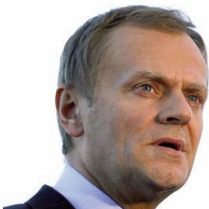
Donald Tusk Primer ministro de Polonia

En el informe, el CCBE y IBA, expresan su preocupación sobre la amenaza de la independencia de la abogacía y de la magistratura, así como la inoportuna intromisión en el ejercicio de las actuaciones judiciales. Respecto a la profesión de la abogacía, el informe concluye que ha sido debilitada la independencia de la profesión de la abogacía por una serie de medidas aprobadas y propuestas por el anterior Gobierno. Estas medidas implican que la profesión de abogado quede supeditada al organismo del Ministerio de Justicia, introducen una nueva categoría de abogado supervisado completamente por el Ministerio de Justicia, crean un nuevo procedimiento disciplinario para abogados y proponen un máximo de asuntos para todos los abogados que ejercen en Polonia. Algunas de estas normas que aparecen en la Constitución Polaca, alteran del Derecho de la Competencia y los criterios internacionales establecidos en los Principios Básicos sobre la función de los Abogados.