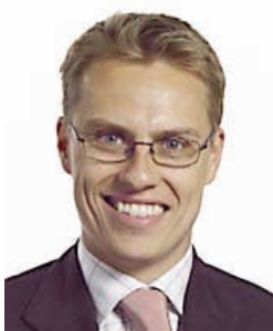
Alexander Stubb Eurodiputado

La Comisión Europea ha hecho pública una consulta sobre el Código de Conducta de los representantes de intereses, disponible en el siguiente enlace: http://ec.europa.eu/commission_barroso/kallas/transparency_en.htm .