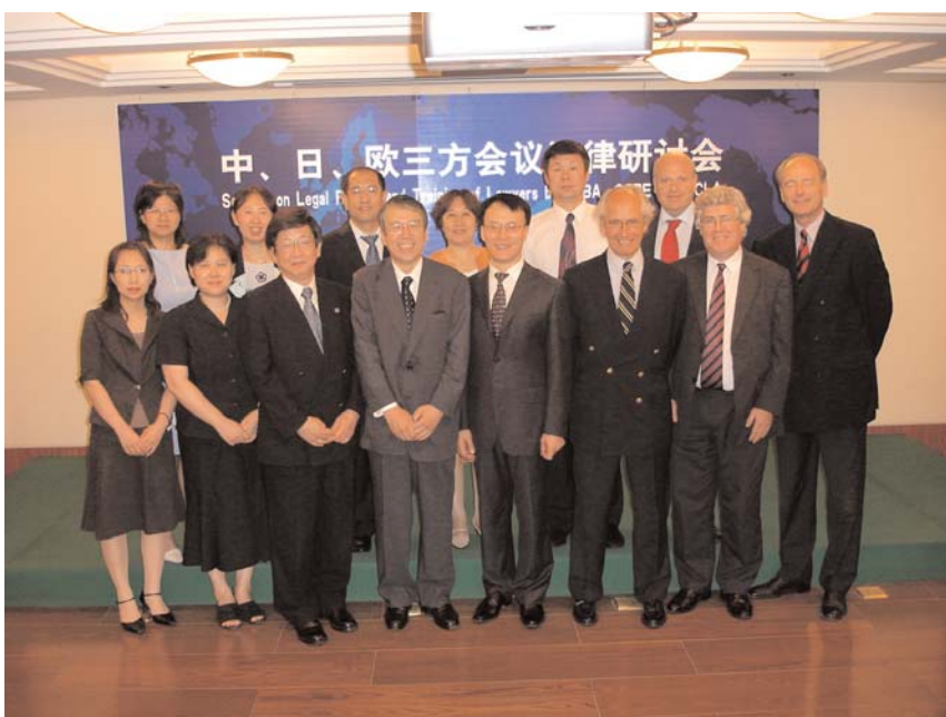
CCBE con los Colegios de Abogados japoneses y chinos

Para más información, puede contactar con Peter Mc Namee ( mcnamee@ccbe.org ).