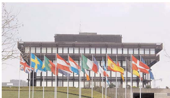
Tribunal de Justicia

El Comité debatió sobre el procedimiento oral ante el TJCE y la falta de diálogo con carácter previo a la vista y durante la vista. El comité tiene previsto enviar un documento a los tribunales sobre el procedimiento oral.