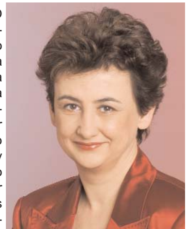
Maria Berger, Eurodiputada

Como informamos en el CCBE INFO N°14, existen en la actualidad dos propuestas legislativas que están siendo debatidas en el Parlamento Europeo: una propuesta de Reglamento destinada a transformar el Convenio de Roma sobre la ley aplicable a las obligaciones contractuales (aprobado en 1980 y de carácter intergubernamental) en Reglamento comunitario, COM (2005)650 (Roma I) y una propuesta modificada de reglamento que busca armonizar las normas para fijar la ley aplicable en caso de litigios civiles no contractuales de carácter transfronterizo ,COM(2006)83, Roma II. La eurodiputada Maria Berger (PSE, Austria) es la ponente designada para Roma I, y la eurodiputada Diana Wallis (ALDE, Reino Unido) para Roma II.