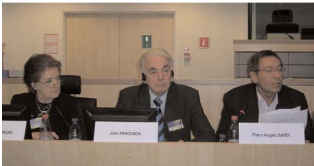
Día Europeo de las Profesiones Liberales, Bruselas , 12/06/2006

El Comité Económico y Social europeo (CESE) organizó el pasado 12 de junio, en Bruselas, el Día Europeo de las Profesiones Liberales, el primero de este estilo.