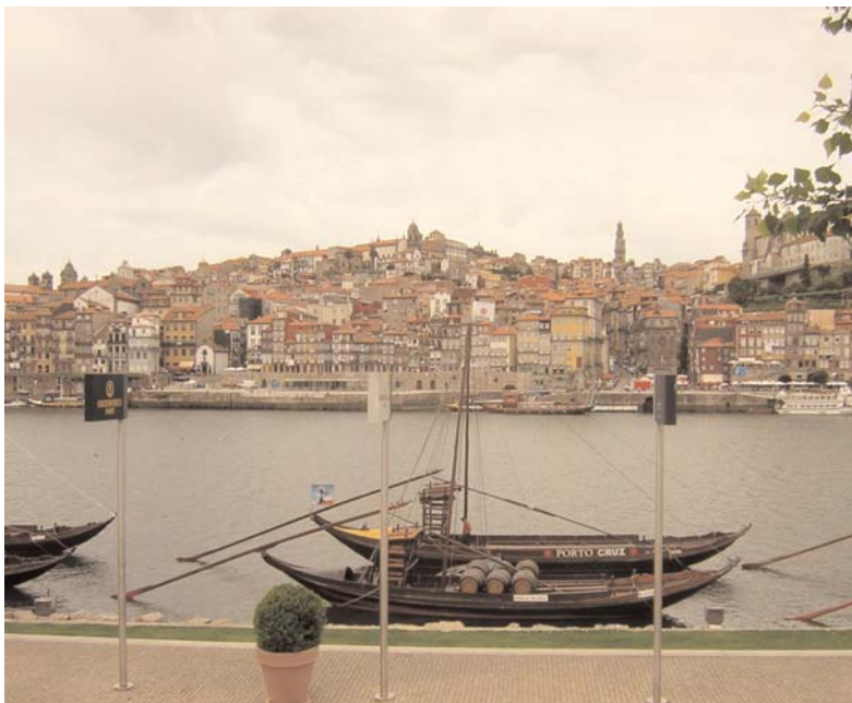
Porto - Portugal

En vista de las novedades surgidas en el ámbito nacional y europeo, el CCBE decidió en septiembre de 2002 revisar su código deontológico, la tercera revisión tras su aprobación en 1988 y contando las revisiones realizadas en 1998 y 2002.