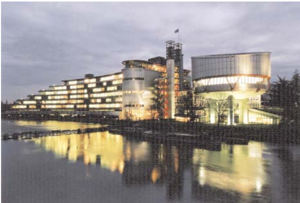
Tribunal Europeo de Derechos Humanos (TEDH)

Se ha circulado un cuestionario a todos los Consejos de la Abogacía sobre la especialización de abogados en el campo de los Derechos Humanos, los mecanismos nacionales de control de los Derechos Humanos y la justicia gratuita. El objetivo del cuestionario es recopilar información sobre las posibilidades de reducir la carga de trabajo del Tribunal Europeo de Derechos Humanos (TEDH).