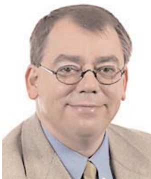
Klaus-Heiner Lehne Eurodiputado

El jueves 29 de junio de 2006, tuvo lugar en el Parlamento Europeo, en Bruselas, una audiencia sobre los derechos de los accionistas en Europa. La audiencia se inscribe dentro del procedimiento de examen, por parte del Parlamento Europeo, de la propuesta de directiva sobre los derechos de los accionistas, presentada por la Comisión Europea en enero de este año.