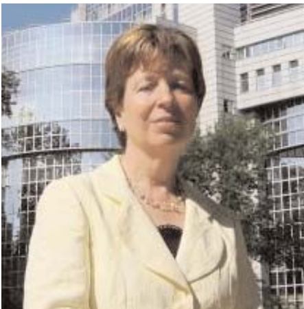
Diana Wallis, Eurodiputada

Como informamos en el CCBE INFO N°14, existen en la actualidad dos propuestas legislativas que están siendo debatidas en el Parlamento Europeo: una propuesta de Reglamento destinada a transformar el Convenio de Roma sobre la ley aplicable a las obligaciones contractuales (aprobado en 1980 y de carácter intergubernamental) en Reglamento comunitario, COM (2005)650 (Roma I) y una propuesta modificada de reglamento que busca armonizar las normas para fijar la ley aplicable en caso de litigios civiles no contractuales de carácter transfronterizo ,COM(2006)83, Roma II. La eurodiputada Maria Berger (PSE, Austria) es la ponente designada para Roma I, y la eurodiputada Diana Wallis (ALDE, Reino Unido) para Roma II.