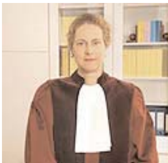
Christine Stix-Hackl Abogado general

El 11 de mayo 2006, el abogado general Stix-Hackl presentó sus conclusiones no favorables a Luxemburgo, objeto de análisis por el Comité de libre circulación de abogados del CCBE (véase: