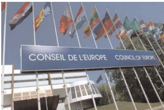
Consejo de Europa

El CCBE ha estado sopesando durante algún tiempo la posibilidad de desarrollar unos principios éticos comunes de la abogacía europea. El trabajo tuvo su origen en la publicación del borrador original en el marco de la Directiva de Servicios (Nov. 2003) que alentaba a todas las asociaciones profesionales europeas a redactar códigos deontológicos a nivel comunitario.