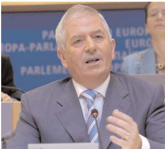
Charlie McCreevy Comisario

El 9 de marzo de 2006, el Presidente de CCBE escribió al comisario McCreevy y a la Dirección General de Mercado Interior y Servicios. La carta transmitía la satisfacción de CCBE ya que los abogados habían sido excluidos de la propuesta de Directiva por el voto del Parlamento.