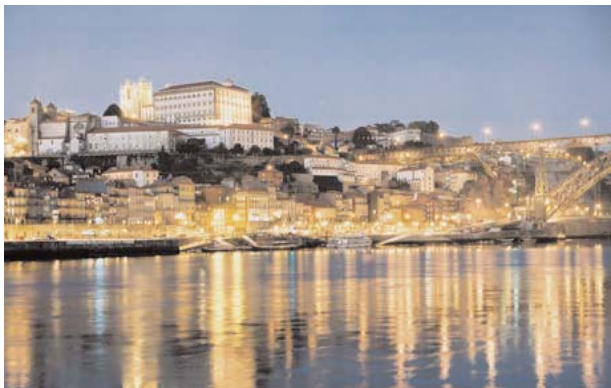
Porto - Portugal

El CCBE está finalizando la tercera revisión del Código Deontológico del CCBE, tras las revisiones de 1998 y 2002. El trabajo de la actual revisión comenzó en septiembre de 2002. Se trata fundamentalmente de adaptar el código de conducta a las exigencias de la Directiva sobre Establecimiento de 1998. La votación sobre la revisión tendrá lugar los días 19 y 20 de mayo de 2006 en la Sesión Plenaria del CCBE que se celebrará en Oporto (Portugal).