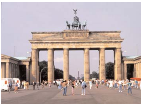
Berlin - Alemania

El grupo de trabajo de CCBE sobre Derecho Contractual Europeo ha continuado su trabajo desarrollando un cuestionario para los miembros. La Comisión Europea, como medida para su plan de acción, pretende preparar y elaborar un "Marco Común de Referencia" (MCR). El MCR trata de establecer un conjunto de herramientas para una mejor legislación, por ejemplo, mejorar la consistencia del acquis communautaire sobre derecho contractual en el desarrollo de reglas comunes y terminología para establecer las bases de una futura legislación en esta área. Puesto que el MCR será de gran importancia para las profesiones jurídicas en Europa, CCBE aspira a jugar un papel activo por intentar influir políticamente en la formación de un futuro derecho contractual europeo. El proyecto de cuestionario recoge también las opiniones de los miembros sobre aspectos de derecho contractual europeo con el fin de encontrar un acuerdo político razonable en el seno de CCBE.