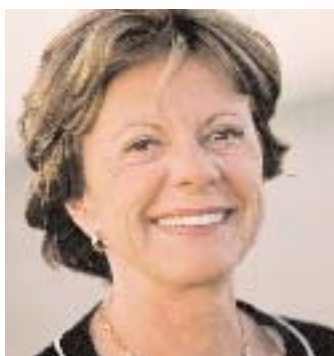
Neelie KROES Comisaria de Competencia

El 24 de noviembre de 2005, el CCBE ha enviado su respuesta tras el informe de la Dirección General de Competencia de la Comisión Europea (DG Competencia) sobre la competencia en el sector de las profesiones liberales.