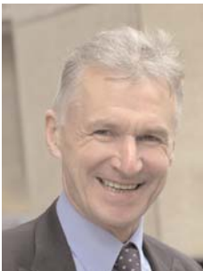
Philipp Lowe Director General de la DG Competencia