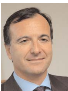
Franco Frattini comisario europeo de Justicia, Libertad y Seguridad

El CCBE ha presentado una propuesta ante las Instituciones Europeas solicitando la creación de un Defensor del Pueblo europeo en materia de Derecho y procedimiento penal (ECLC, en sus siglas en inglés) para corregir el actual desequilibrio existente en el ámbito europeo entre los derechos de la acusación y los derechos de la defensa. La principal tarea del Defensor sería proteger y garantizar los derechos de los sospechosos, inculcados y aquellos que estén siendo investigados, en litigios o asuntos transfronterizos o transnacionales en la UE.