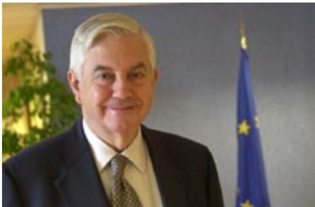
Comisario Frits Bolkestein

El 7 de de junio de 2004, el CCBE se reunió con el comisario Frits Bolkestein, Jefe de la Dirección General de Mercado Interior de la Comisión Europea. El encuentro seguía a la reunión que el CCBE mantuvo con el comisario en mayo de 2002. El CCBE planteó varias cuestiones en esta reunión, y lo más importante, abordó el estado en que se encuentra el Diálogo Regulador de los Mercados Financieros entre UE-USA (y la posible ayuda del CCBE en este contexto) así como las más recientes y próximas actividades de la Comisión en el área del Derecho de sociedades. El presidente del CCBE subrayó la constructiva cooperación existente con el comisario y sus servicios, y expresó su deseo de que ésta se mantenga.