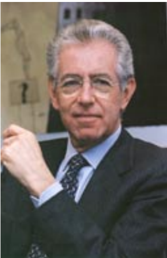
Comisario Mario Monti

El 9 de de junio de 2004, una delegación del CCBE se reunió con el comisario Monti, de la DG Competencia, para abordar las actividades actuales de la Comisión en el campo de las profesiones liberales, y en particular, los puntos de vista del CCBE sobre el Informe de la Comisión relativo a la competencia en los servicios profesionales, publicado el 9 de febrero de 2004. El diálogo con la Comisión fue muy constructivo, y el comisario invitó al CCBE (y a sus organizaciones miembro) a que transmitan cualquier preocupación suscitada por el Informe y el ejercicio previo de recopilación.