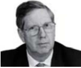
Sir David Clementi

a este documento de consulta. Asimismo, durante la reunión de Comité de competencia del CCBE del 27 de abril 2004, se acordó que la respuesta no consistiría en respuestas específicas a las preguntas planteadas, sino que contendría una visión europea global, subrayando los valores esenciales de la profesión y el requisito de independencia. El documento de respuesta final subraya, entre otras cosas, que la autoregulación es esencial para mantener la independencia. El texto se envió a Sir David Clementi el 4 de junio de 2004.